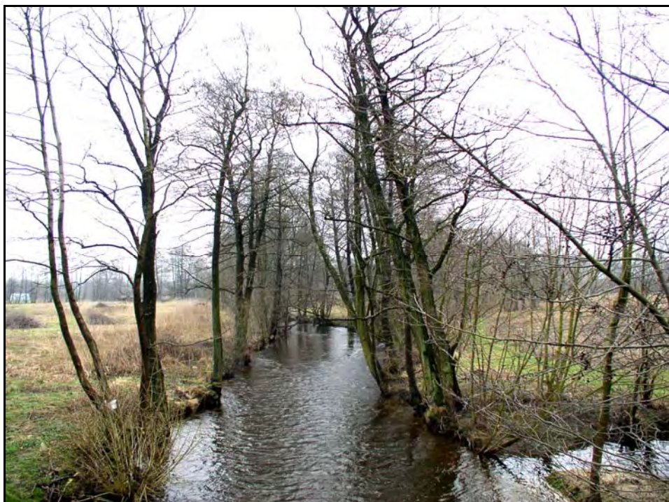
Fot. 39. Stan środowiska w marcu 2007 r.: km 22+500, rzeka Łeba w Bożympolu Wielkim