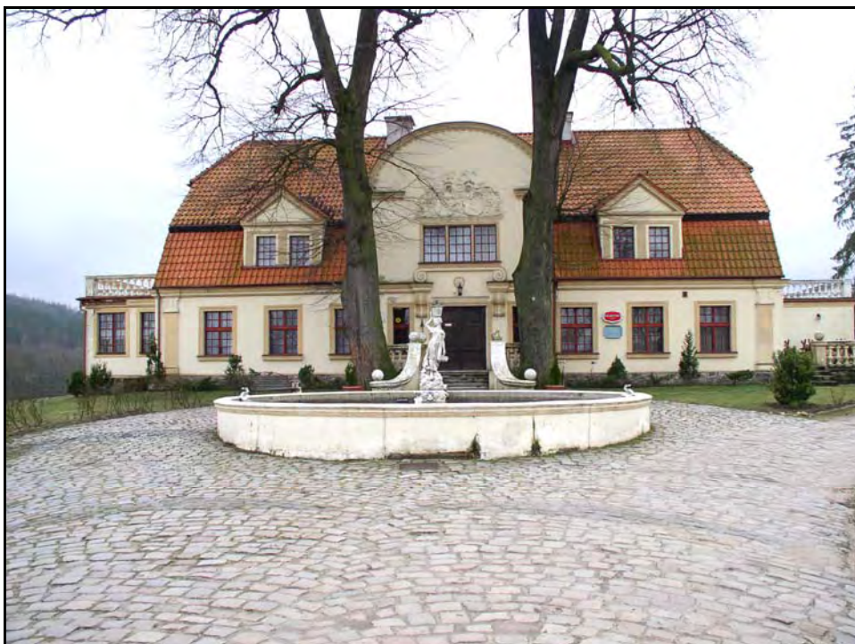
Fot. 42. Stan środowiska w marcu 2007 r.: km 25+000, zabytkowy dwór w Paraszynie; z lewej dolina Łeby i Las Strzebieliński