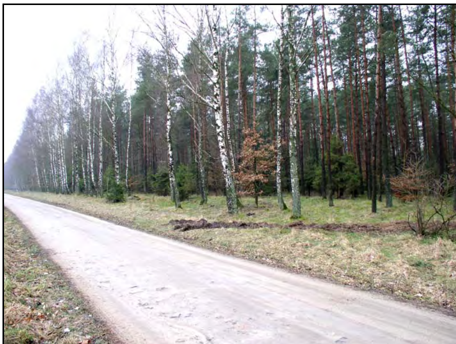
Fot. 37. Stan środowiska w marcu 2007 r.: km 22+000, skraj Lasu Paraszyńskiego i „Paraszyńskich Buczyn” w Bożympolu Wielkim przy drodze do Jezewa