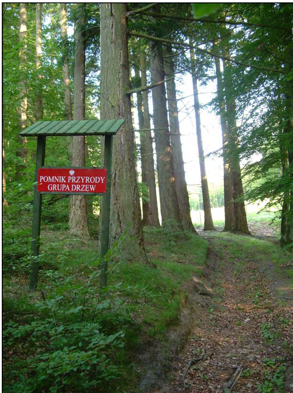
Fot. 31. Stan środowiska w czerwcu 2007 r.: km 15+700, daglezje – pomniki przyrody w Lesie Paraszyńskim koło Godętowa