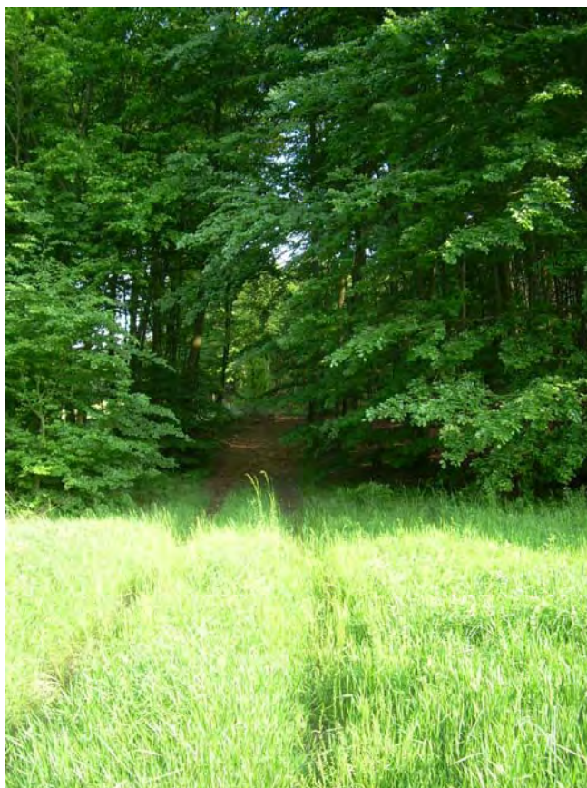
Fot. 30. Stan środowiska w czerwcu 2007 r.: km 15+700, buczyna na skraju Lasu Parazyńskiego koło Godętowa