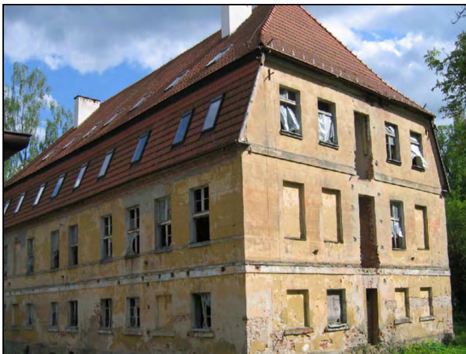
Fot. 40. Stan środowiska w lipcu 2006 r.: km 23+200, pałac w Bożympolu Małym