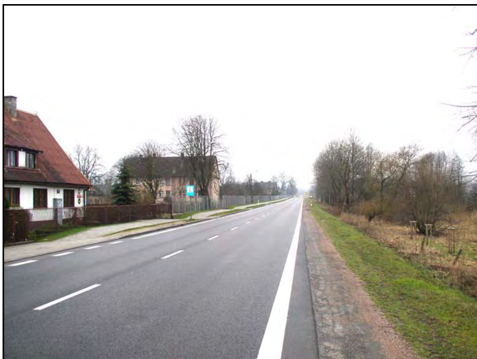
Fot. 38. Stan środowiska w marcu 2007 r.: km 22+500, droga nr 6 w Bożympolu Wielkim; po prawej taras zalewowy w dolinie Łeby