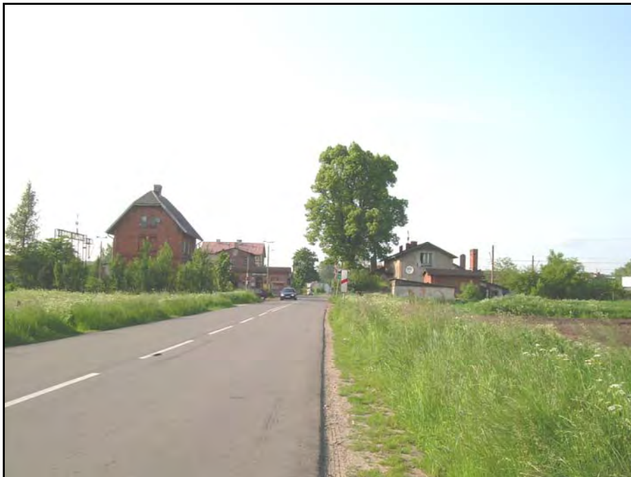
Fot. 26. Stan środowiska w czerwcu 2007 r.: km 15+100, południowy skraj zabudowy Łęczyc; miejsce projektowanego węzła „Godętowo” w wariantcie II