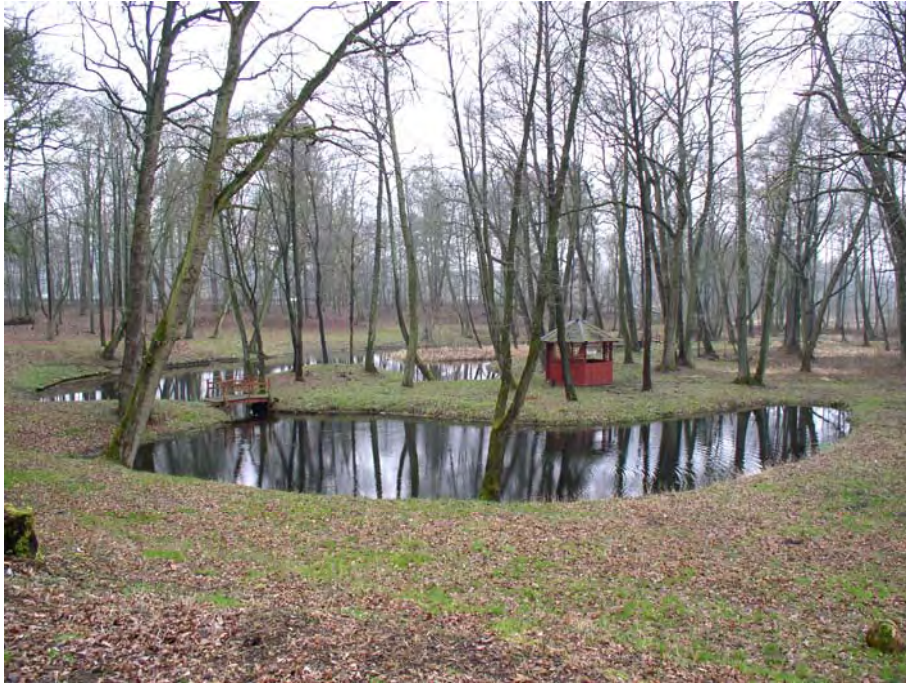
Fot. 34. Stan środowiska w marcu 2007 r.: km 21+800, park podworski w Bożympolu Wielkim; 150 m od trasy w wariantcie II