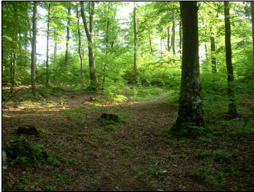
Fot. 27. Stan środowiska w czerwcu 2007 r.: km 17+800, buczyna w Lesie Łęborskim; w poprzek miejsce projektowanej trasy S6 w wariantcie III