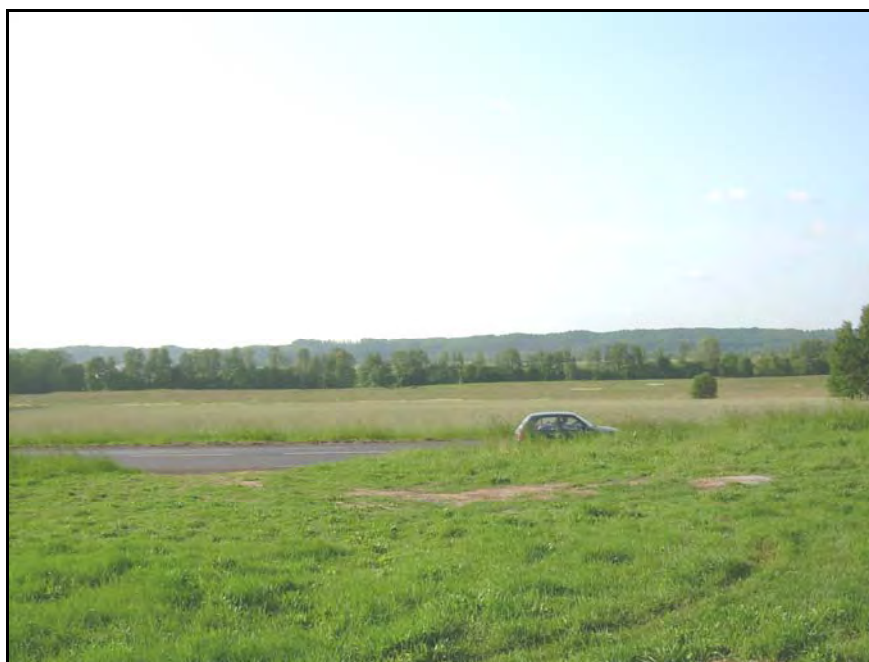
Fot. 29. Stan środowiska w czerwcu 2007 r.: km 15+700, Pradolina Łeby w Godętowie; na pierwszym planie droga w poprzek droga nr 6; w głębi Lasy Lęborskie