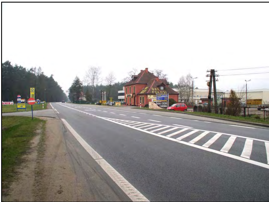
Fot. 44. Stan środowiska w marcu 2007 r.: km 26+000, droga nr 6 w Strzebielinie; w głębi Las Strzebieliński