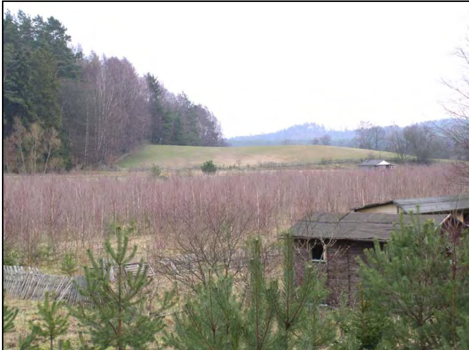
Fot. 41. Stan środowiska w marcu 2007 r.: km 25+000, Wzgórza Parazyńskie w Paraszynie; z lewej skraj Lasu Parazyńskiego i „Parazyńskich Buczyn”; z prawej w głębi dolina Łeby i Las Strzebieliński