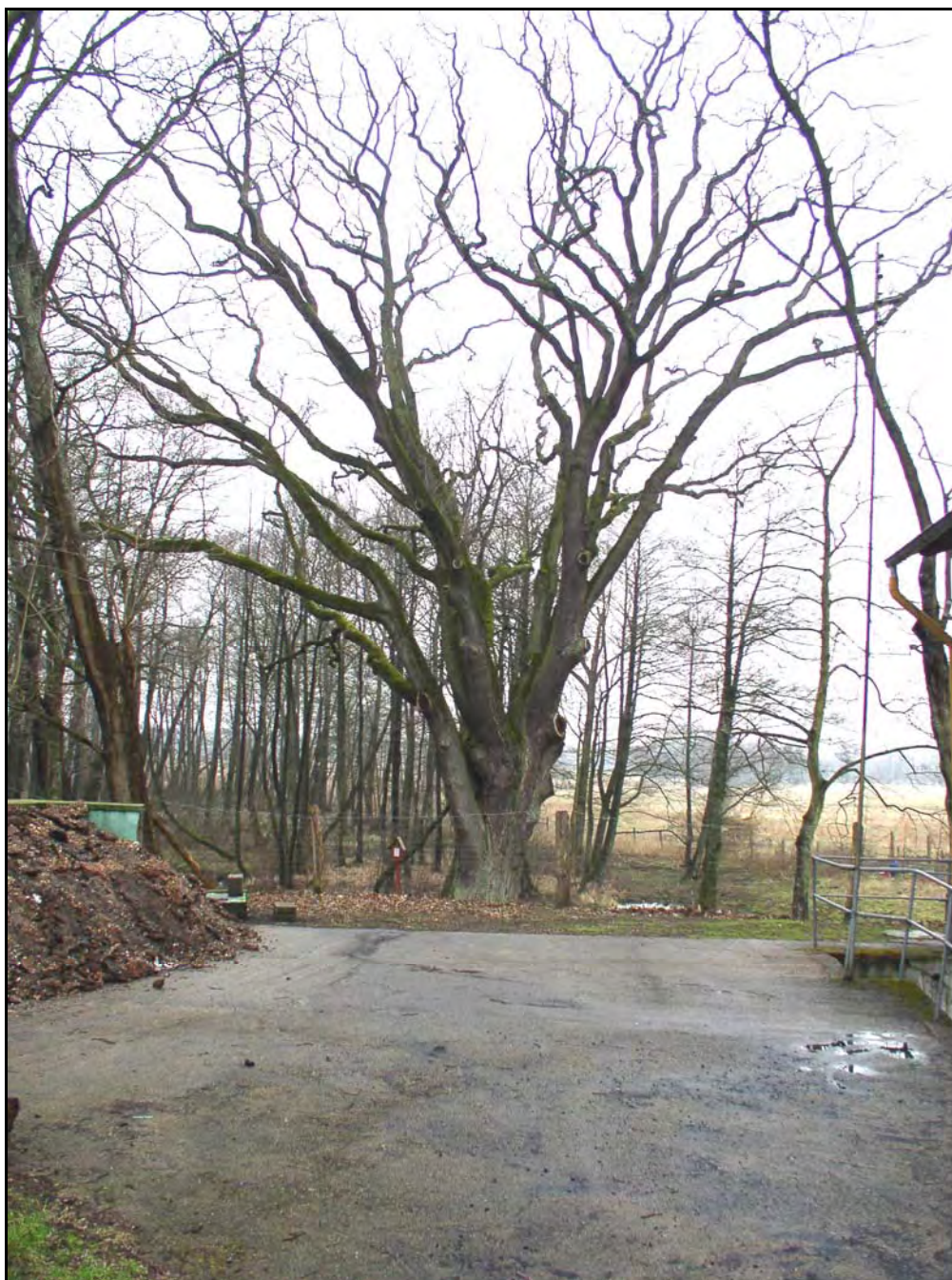
Fot. 36. Stan środowiska w marcu 2007 r.: km 21+800, dąb – pomnik przyrody w parku podworskim w Bożympolu Wielkim; w głębi taras zalewowy w dolinie Łeby