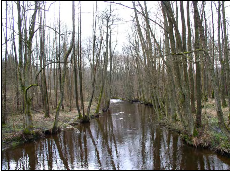
Fot. 43. Stan środowiska w marcu 2007 r.: km 25+000, rzeka Łeba w Paraszynie; północny skraj projektowanego obszaru chronionego NATURA 2000 „Dolina Górnej Łeby”