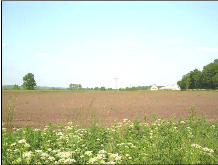
Fot. 25. Stan środowiska w czerwcu 2007 r.: km 15+100, pola i lasy między Godętowem a Łęczycami; miejsce projektowanej trasy w wariantcie II