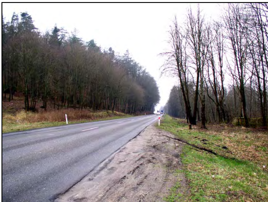
Fot. 33. Stan środowiska w marcu 2007 r.: km 19+800, przejście drogi nr 6 przez Las Paraszyński w Wielistowie; po lewej stronie drogi projektowany obszar chroniony "Paraszyńskie Buczyny"