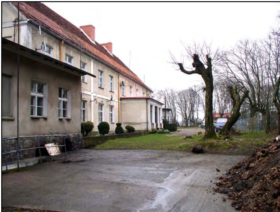
Fot. 35. Stan środowiska w marcu 2007 r.: km 21+800, zabytkowy pałac w Bożympolu Wielkim (obecnie przedszkole); po prawej skraj parku podworskiego