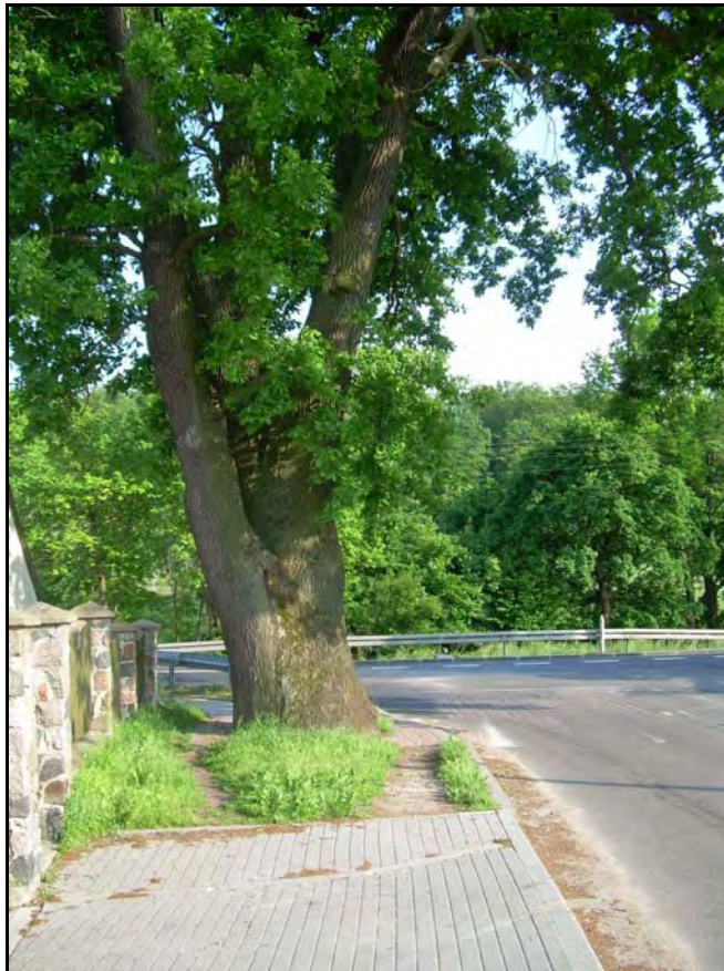
Fot. 24. Stan środowiska w czerwcu 2007 r.: km 15+100, dąb – pomnik przyrody w Godętowie przy skrzyżowaniu drogi nr 6 z drogą do Łęczyc