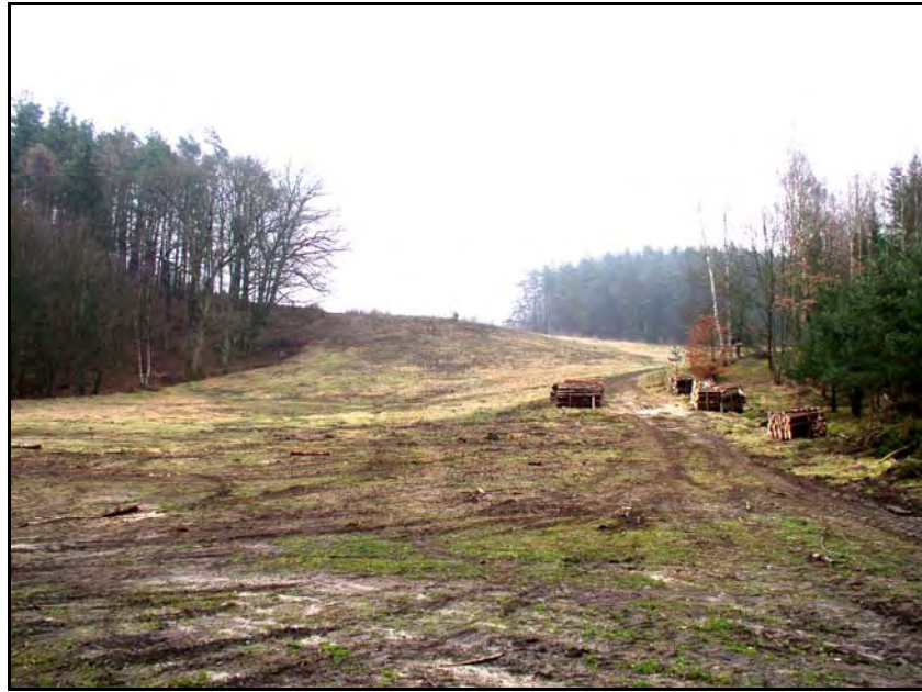
Fot. 23. Stan środowiska w marcu 2007 r.: km 14+700, Las Lubowidzki w Godętowie; w głębi po lewej grupa dębów – pomników przyrody